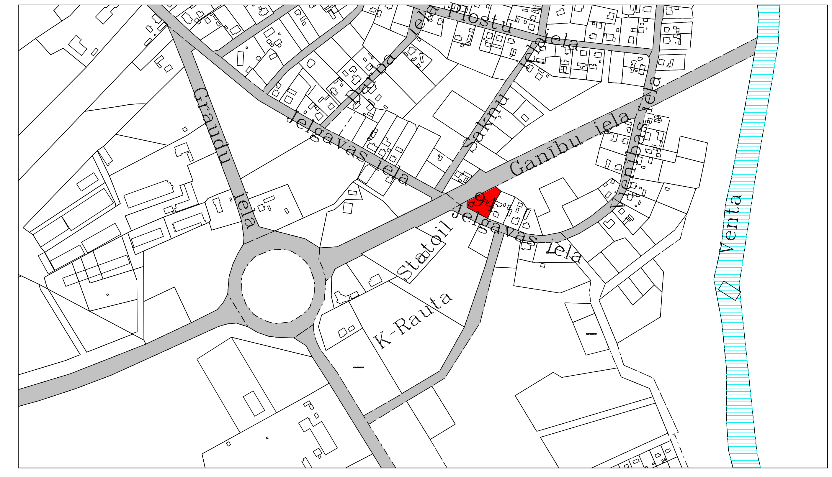
ZEMESGABALA IZVIETOJUMA SHĒMA