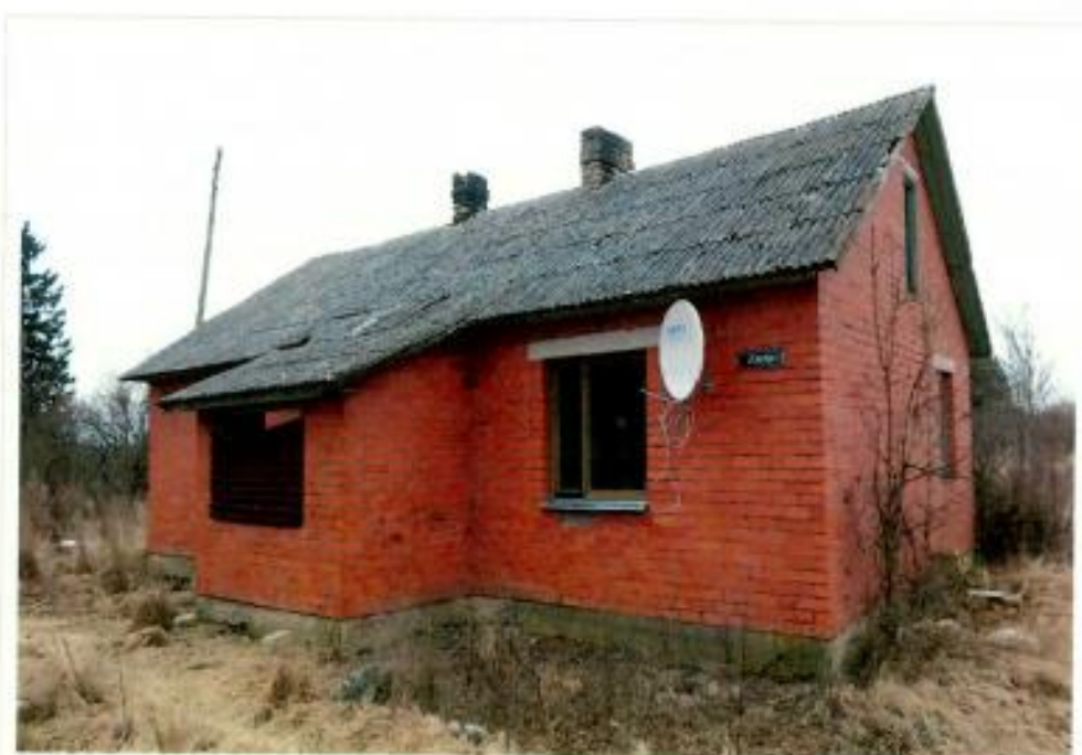
Kuldīgas novada Turlavas pagasta “Ziediņi”