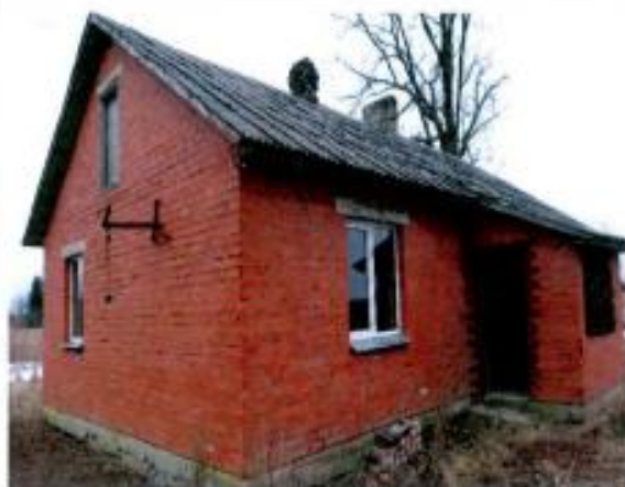
Dzīvojamās ēkas fasādes