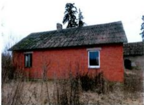
Ēkas aizmugures skats