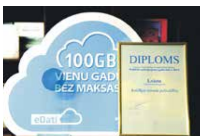
Kuldīga ieguvusi 1. vietu publisku pakalpojumu jomā starp lielajiem novadiem un pašvaldībām.

pašvaldību pašnovērtējums, pašvaldībā strādājošo uzņēmēju viedoklis, pašvaldības teritorijā reģistrēto uzņēmumu skaits (jo lielāks, jo augstāks punktu skaits), uzņēmumu skaits ar pašvaldības kapitāla daļību (jo mazāks, jo augstāks punktu skaits), t.s. kontrolpirkums jeb pašvaldības atbilde uz konkrēta uzņēmēja e-pastā uzdotajiem jautājumiem par iespējām uzsākt uzņēmējdarbību, kā arī pašvaldības vieta Latvijas e-indeksā.