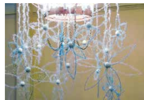
Vārmes pamatskolas skolotāji un audzēkņi ieguva 1. vietu ar pašdarinātajiem Ziemassvētku dekoriem.

Konkurss tika organizēts no 1. līdz 30. decembrim, lai radītu Ziemassvētku noskaņu Kuldīgas pilsētā un novadā, kā arī noskaidrotu oriģinālāko skatlogu, telpu, ēku fasāžu, pagalmu, priekšpagalmu īpašniekus vai apsaimniekotājus