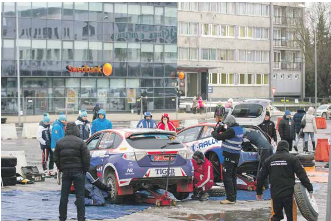
Kuldīgas pilsētas laukums rallija laikā kļuva par servisa parku.