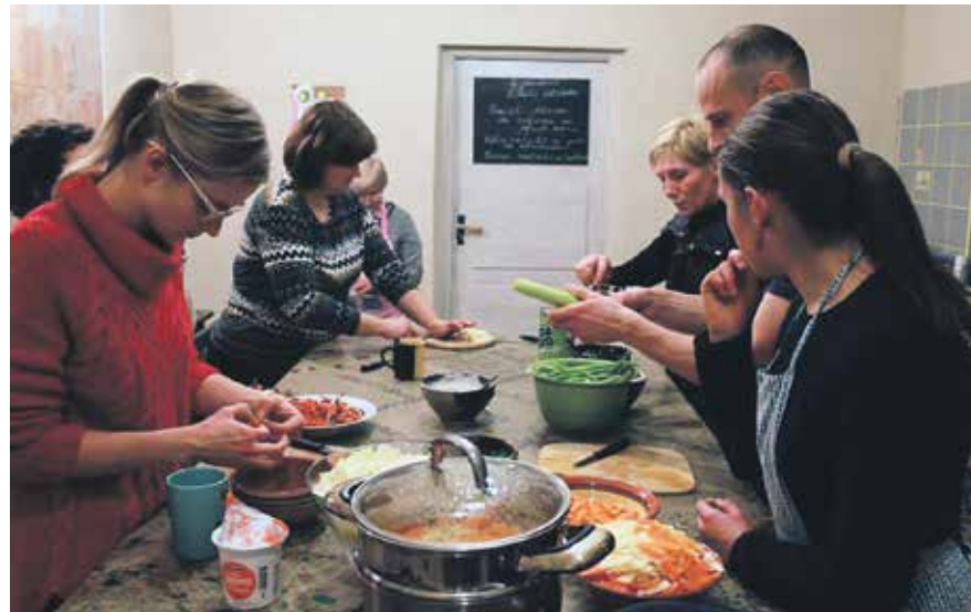
Biedrības „Kūrava” radītā „Virtuves studijā” ik nedēļu tiekas gastronomi, lai izzinātu latviešu un cittautu virtuves kultūru.

Biedrības „Kurzemes kultūras mantojuma centra „Kūrava”” radītā „Virtuves studija” saņēmusi atbalstu ne vien novada iedzīvotāju iniciatīvu projektu konkursā, bet arī Latvijas mērogā.