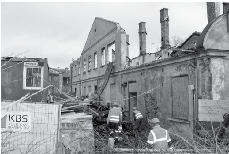
Ēkai Skolas ielā 2 uzsākti glābšanas darbi.

Nama Skolas ielā 2 īpašnieks – SIA „Cēsu projekts” – ir informēts par ēkas stāvokli un par pašvaldības uzsāktajiem bīstamības novēršanas pasākumiem viņam piederošajā īpašumā. Līdz šim SIA „Cēsu projekts” nav izrādījis nekādu interesi par notiekošo. Lai novērstu nama sabrukšanu, pašvaldība ir uzsākusi sabiedrībai bīstamās ēkas glābšanu,