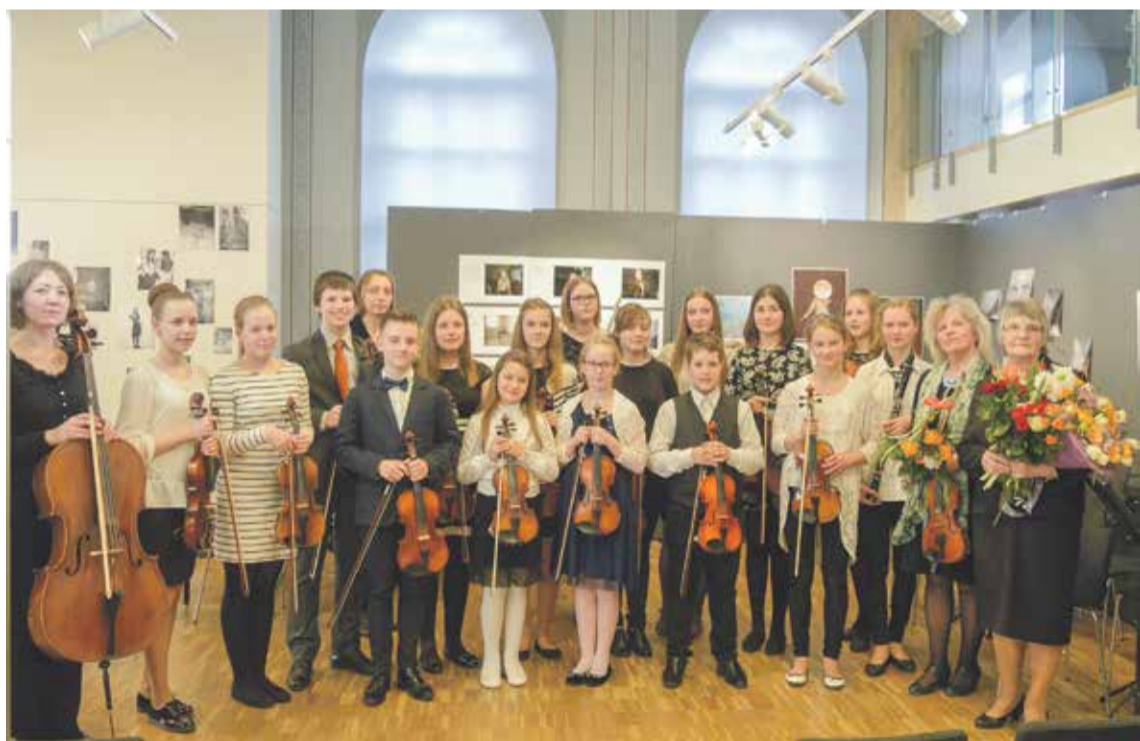
Stīgu instrumentu nodaļas 6. – 8. klases audzēkņi un pedagoģes kamerorķestra 5 gadu jubilejas koncertā.

Muzikālās uzstāšanās izskaņā orķestranti teica lielu paldies diriģentei, bet skolotāja V. Jūrmale pateicās klausītājiem, orķestrantiem un viņu vecākiem, skolotājām L. Saulgriezei,