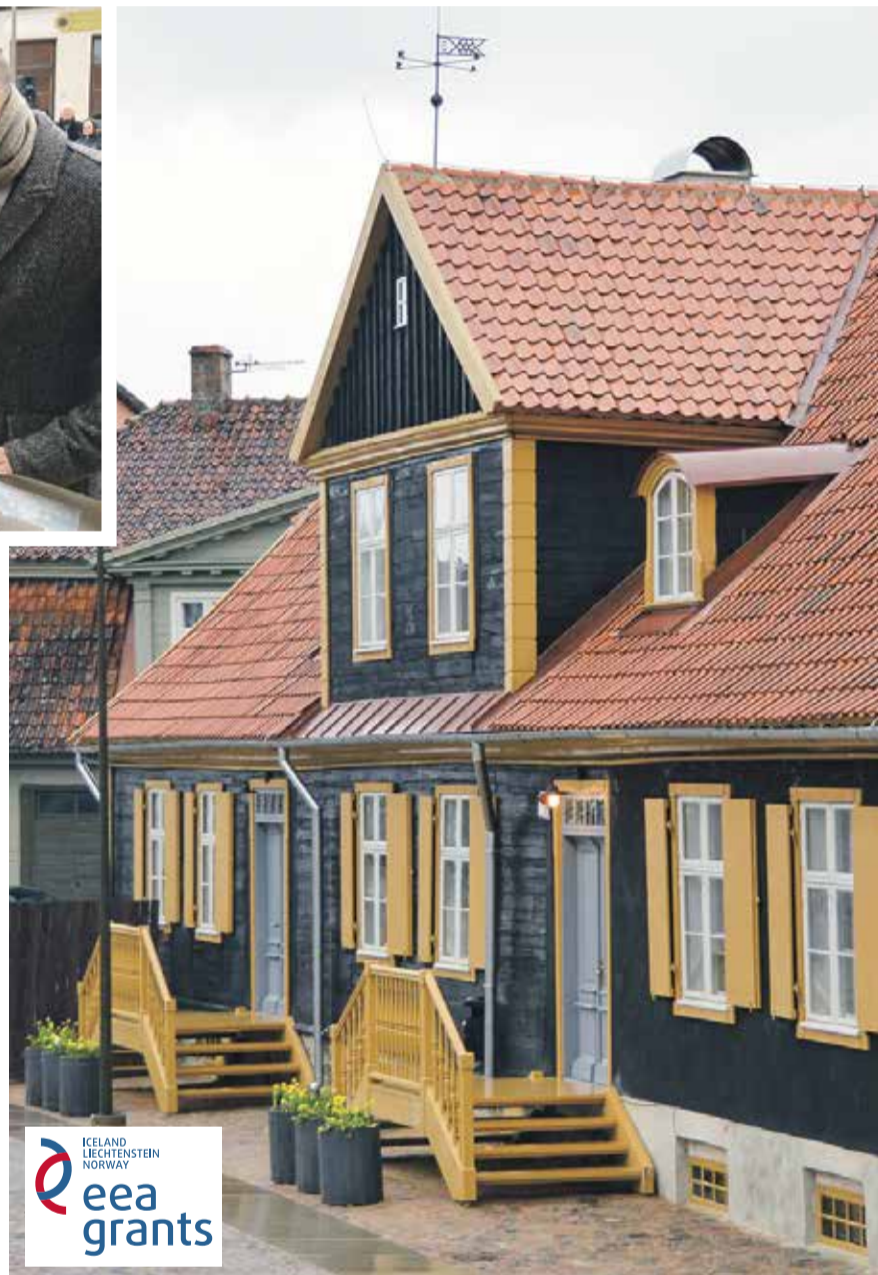
Vecais rātsnams pēc restaurācijas ir atguvis savu vēsturisko krāšņumu.