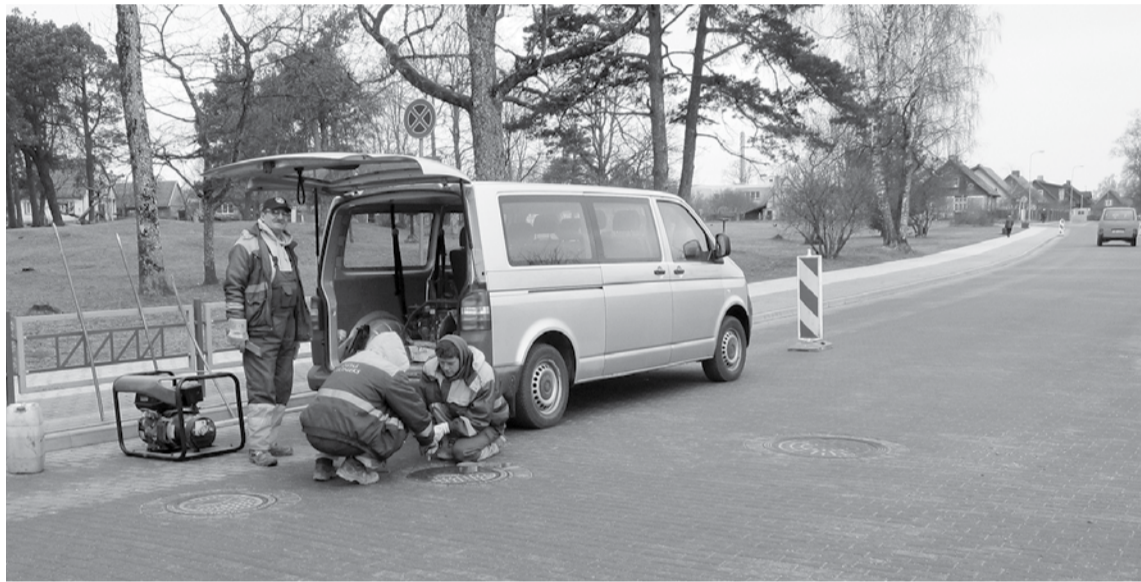
Parka ielā novērsti aku iesēdumi.

No 30. marta SIA „Ostas celtnieks” uzsākusi garantijas laikā radušos defektu novēršanu projekta „Kuldīgas pilsētas ielu tīkla uzlabošana” objektos.