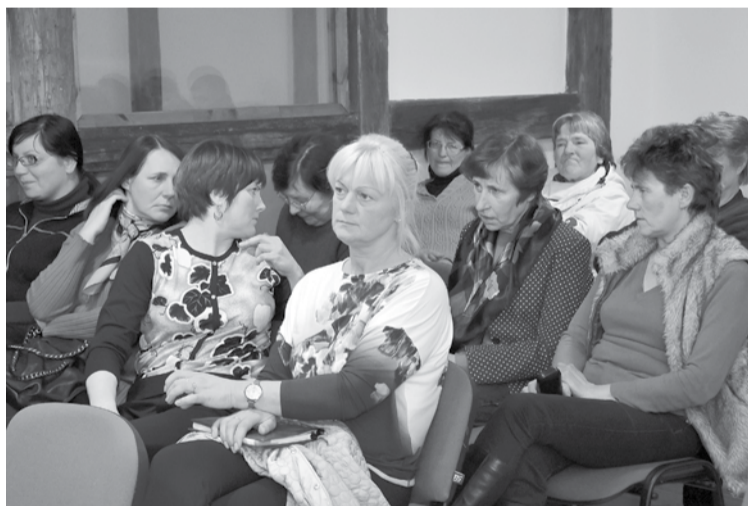
Laideniekus interesē gan paveiktais pērn, gan iecerētais un darāmais šogad.