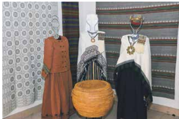
Rātsnamā izvietotas Tautas lietišķās mākslas studiju „Varavīksne” 50 gadu un „Kocis” 40 gadu jubilejas izstādes.