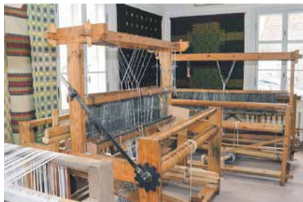
Mākslas studijas „Varavīksne” aušanas stelles iekārtotas jaunās telpās.