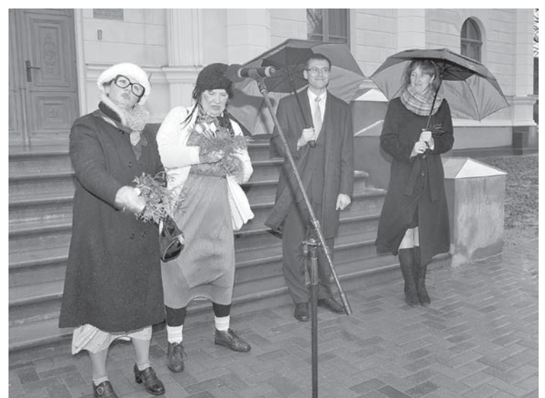
Svinīgajā pasākumā jautrību ieviesa viešņas no Vārmes.