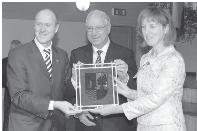
Gēsthahtes delegācija šogad Kuldīgā viesojusies jau divas reizes – Latvijas Republikas proklamēšanas dienā – 18. novembrī (attēlā), kā arī pilsētas svētkos vasarā.

Pirmo Adventi Kuldīgas kultūras centra kamerkoris „Rāte” sagaidīja Vācijā, kur sniedza piecus koncertus dažādās baznīcās un sadraudzības pilsētas Gēsthahtes Ziemassvētku tirdziņā, informē kamerkora dzie-