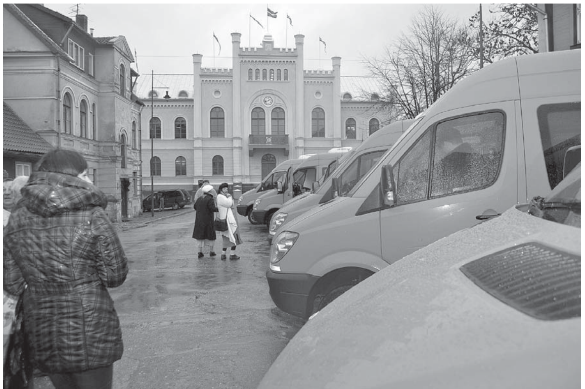
Pirms došanās mājup oranžie autobusi glīti sastājušies Kuldīgas Rātslaukumā.

Snēpeles jaunais skolēnu auto- buss sāks kursēt decembra vidū.