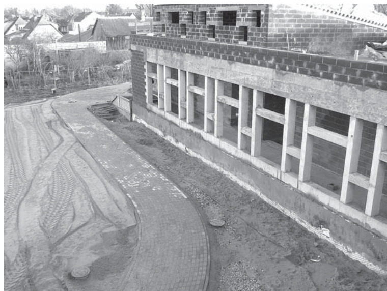
Šobrīd „Ābelītē” jau ir paveikti vairāk nekā 60% no visiem būvdarbiem.

„Ļoti ceram uz labvēlīgiem laika apstākļiem, lai ar februāri bērnu darza kolektīvs varētu atsākt