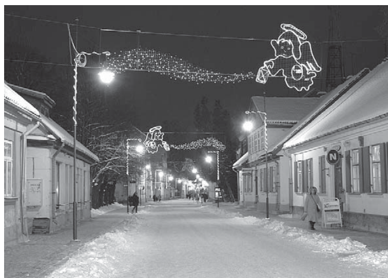
Eņģeļi šogad Kuldīgā redzami daudzviet, arī Liepājas ielā.

No Rumbas pagasta iedzīvotāja par simbolisku samaksu iegādātā skaistā pilsētas egle greznojas un