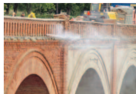
30. augustā satiksmi tika slēgts masīvais Ventsas tilts, sākās tā restaurācijas darbi, ko iecerēts pabeigt nākamā gada vasarā.