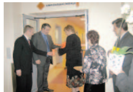
8. martā Kuldīgas slimnīcā veselības ministrs Vinets Veldre pārgriež simbolisko atklāšanas lenti jaunizveidotajai Ģinekoloģijas nodaļai.