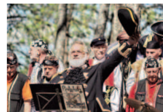
"Puikas, ejam filmēties!" jeb masu skatos par Otrā pasaules karu tēmu Lietuvas kinostudijas un Vācijas kopražojuma televīzijas filmā "Tilts" iejutās ap 120 kuldīdznieku.