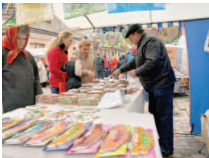
Ziemas festivāla rīkotāji mudināja jau laikus gādāt dāvanas saviem mīļajiem Ziemassvētkos. 1.decembrī Liepājas ielā darbojās Dāvanu tirdziņš.