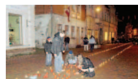
Patriotismu Kuldīgas skolēni mācās, nevis skolas solā šēžot, bet veidojot Gaismas ceļu par godu Latvijas dzimšanas dienai 18. novembrī.