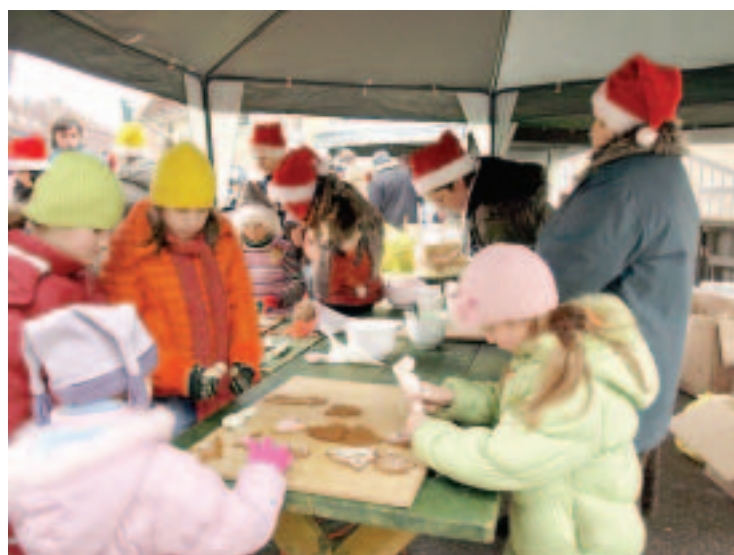
Rūķu darbnīcā Rātslaukumā mazie kuldīdznieki mācījās glazēt piparkūkas, liet sveces, gatavot Ziemassvētku rotājumus un eņģeļišus.