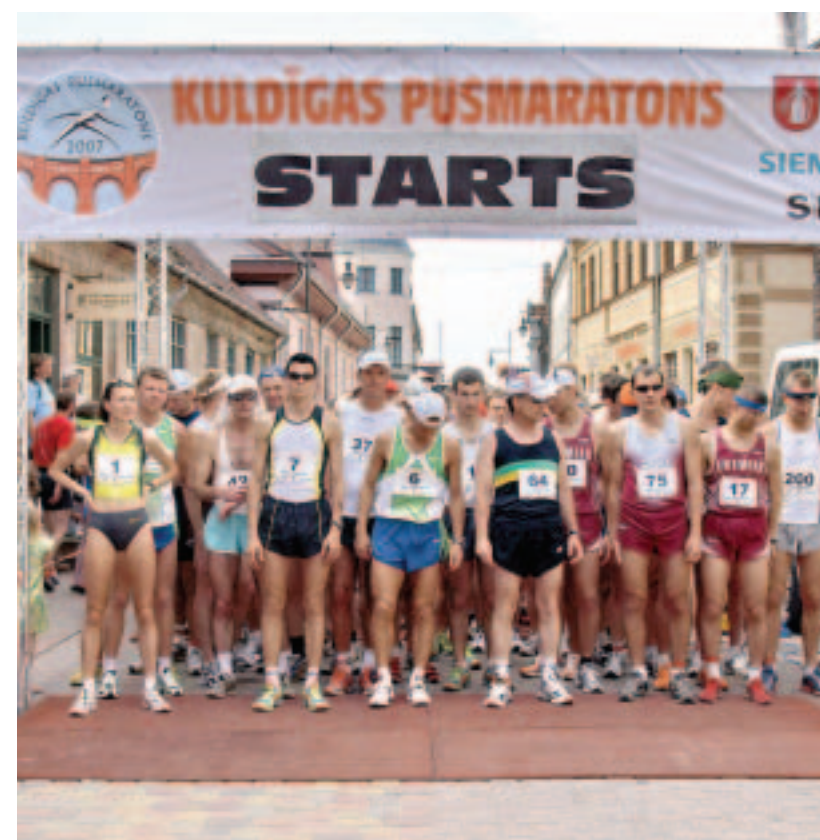
11. augustā uz starta līnijas vecpilsētā 210 sportistu pulcēja jau otrais Kuldīgas pusmaratons, šoreiz arī Latvijas čempionāts pusmaratonā. Starp dalībniekiem bija arī pasaules elites skrējēji.