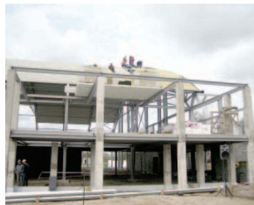
19. aprīlī Kuldīgas vieglatlētikas manēžai tika svinēti spēru svētki. 18. decembrī būvuzņēmējam "RBS Skals" jānodod būve ekspluatācijā.