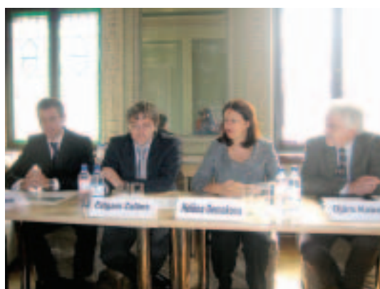
11. septembrī, dienu pirms starptautiskās konferences "Tilts Kuldīgā – tilts uz pasauli" – Rīgā tika rīkota preses konference, kurā kultūras ministre Helēna Demakova uzslavēja kuldīdznieku centienus Kuldīgas vecpilsētas saglabāšanā un popularizēšanā.