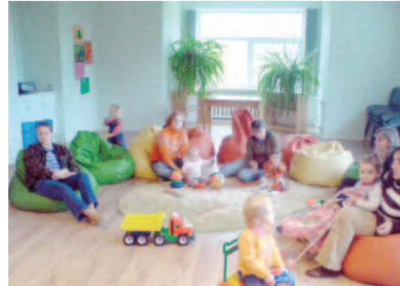
Iedzīvotāju iniciatīvu konkursā "Darīsim paši!" šogad pilsētā īstenoti 10 projekti. Attēlā – labiekārtojumi Māmiņu klubā.