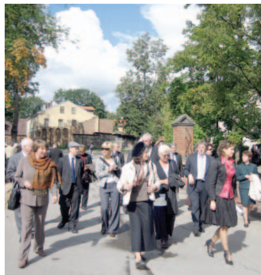
11. septembrī, atsaucoties Domes un Latvijas institūta ielūgumam, Kuldīgā viesojās Latvijas Republikā akreditētie vēstnieki un viņu padomnieki.