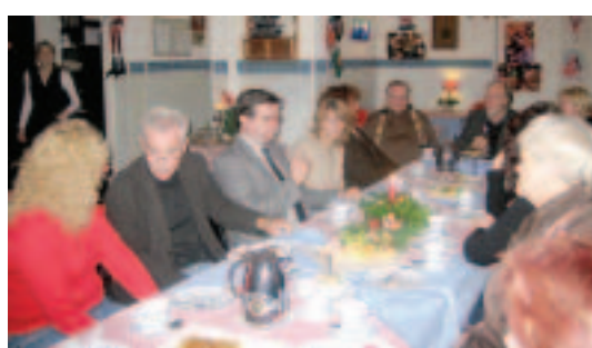
Decembrā sākumā Domes delegācija apmeklēja sadraudzības pilsētu Gēsthahtu Vācijā un vienojās, ar kādiem pasākumiem tiks atzīmēta mūsdienu sadarbības līguma gadskārta.