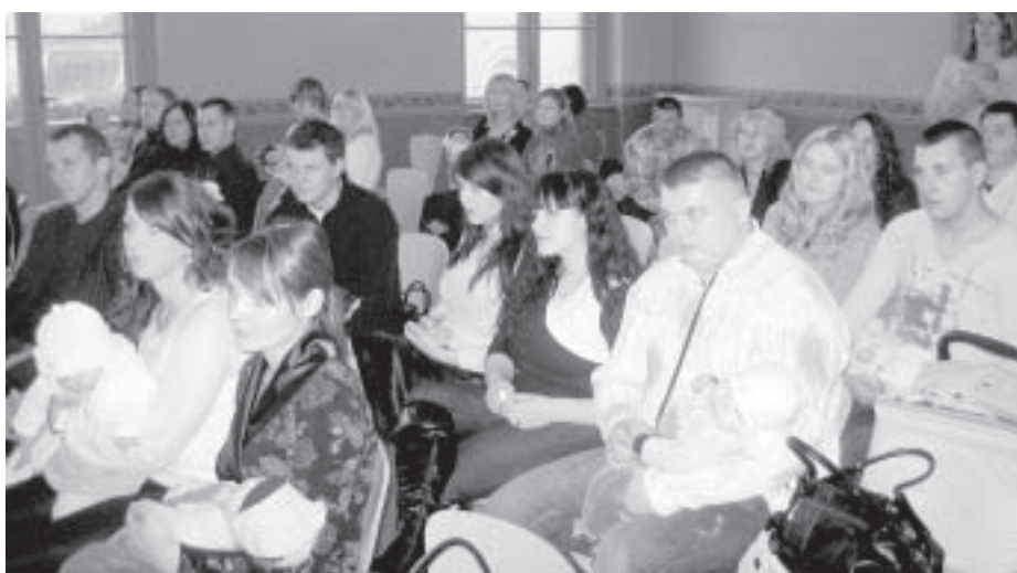
Pirmā pieņemšana Kuldīgas pilsētas Domē un pirmais 2007.gada septembrī un oktobrī Kuldīgā dzimušo mazuļu kopējais foto.

I.Bērziņa novēlēja jaundzimušajiem un viņu vecākiem mīlestību un aicināja vecākus audzināt bērnus par savas dzimtas pilsētas patriotiem, un lai Kuldīgas sudraba karotīte