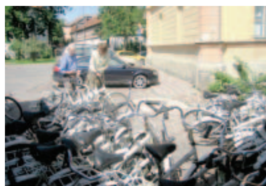
Pateicoties labajai sadarbībai, kas Domei izveidojusies ar nīderlandiešu fondu KNHM, jūlijā tiek saņemts dāvinājums – 234 velosipēdi – no Nīderlandes.