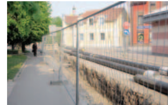
Maijā Kuldīgā sākās siltumtrašu vērienīga rekonstrukcija, kam finansējumu Dome piesaistījusi no Eiropas Reģionālās attīstības fonda.