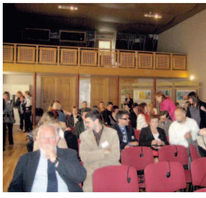
Trīs dienas septembrī Kuldīgā norisinājās starptautiskā konference "Tilts Kuldīgā – tilts uz pasauli", kurā ap 40 kultūras mantojuma, tūrisma un sabiedrisko attiecību speciālistu atgādināja mums, kuldīdzniekiem, par Kuldīgas vērtībām.