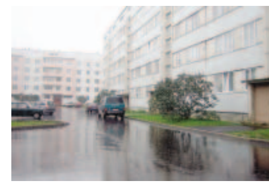
Pozitīvas pārmaiņas aizvadītajā vasarā sagaidīja Gaismas ielas 4. un 6. daudzdzīvokļu nama iedzīvotāji, jo tika noasfaltēti pagalmi un iebrauktuve