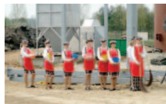
27. aprīlī ar jauniešu teātra "Focus" atraktiem priekšnesumiem iebūvēja kapsulu par godu topošajai katlumājai. 2007.–2008. apkures sezonā Kuldīgā sāk darboties Baltijā modernākā katlumāja.