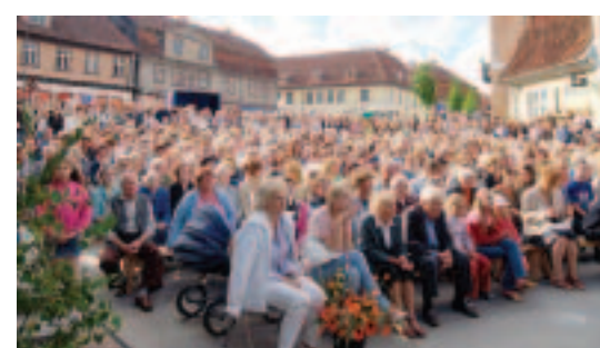
Latvijā un pasaulē ir daudz svētku, bet "Dzīres" ir tikai Kuldīgā, tādēļ droši var apgalvot, ka vislabākā nedēļas nogale aizvadītajā vasarā bija no 11. līdz 15. jūlijam mūsu pilsētā.