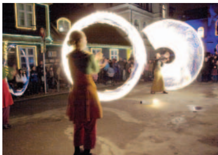
Ielu teātra grupa "Norden Fra" no Dānijas žonglēja ar uguns lodēm un lentēm, aicinot iejusties viduslaiku gaisotnē.