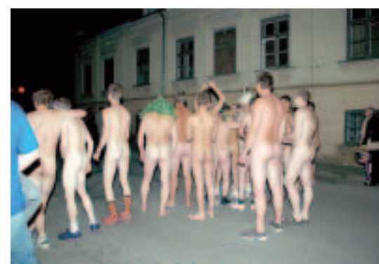
Jāņu naktī notika 7. pliko skrējieni, kura dalībniekiem kā vienīgais pieļaujams piesegs drošība būt Jāņu vainags vai pirts cepure.