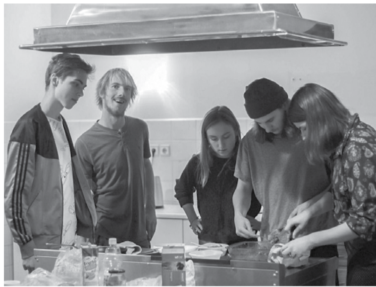
Jaunieši organizēja kulinārijas vakaru, kurā pagatavoja veģetāro lasanju, ko baudīja pie tējas tases, risinot sarunas.

SIGNETA LAPINA, sabiedrisko attiecību speciāliste