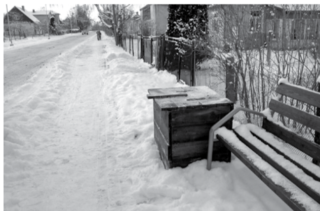
Putnudārzā vienīgā ietve ir Dzelzceļa ielā. Tās tīrība un kopšana ir tur dzīvojošo iedzīvotāju pārziņā.

ANITAS ZVINGULES, KKP sabiedrisko attiecību speciālistes, teksts un foto