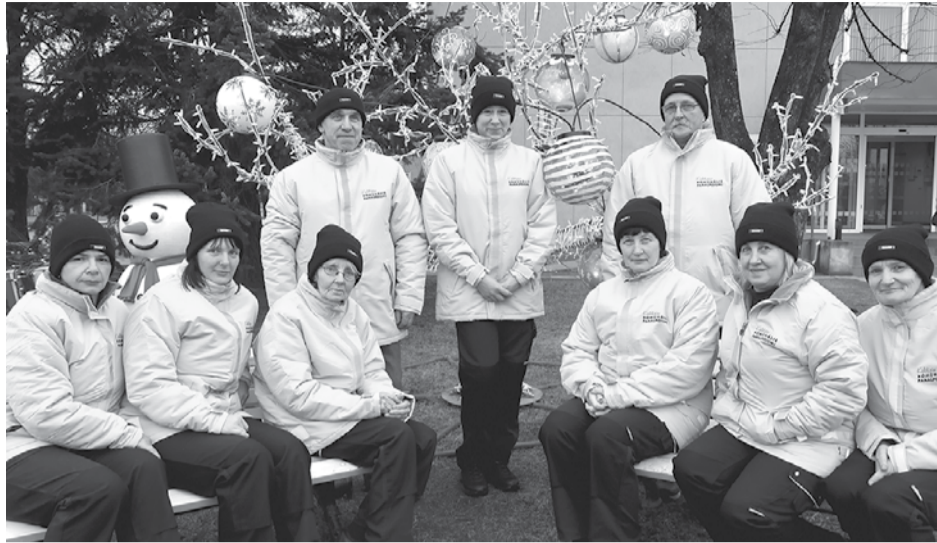
Kuldīgas centrā strādājošie sētnieki tērpi ziemas jakās. Sanitārās tīrīšanas sektora darbinieki atzīst, ka jakas ir ērtas, siltas un labi pamanāmas.

Uzņēmuma ziemas dienests sniedz arī ārpalpojumu – tīra sniegu no veikalu un iestāžu stāv-