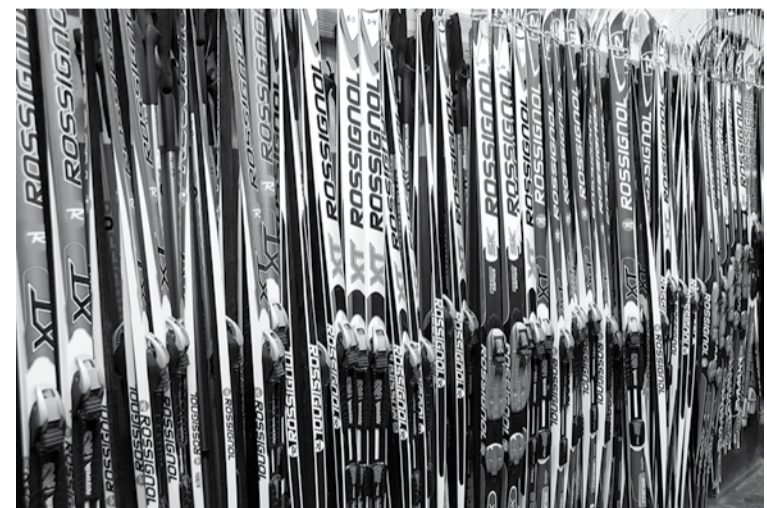
Arī šogad interesentiem ir iespēja iznomāt slēpes, zābakus un nūjas.

Baudīsim ziemas priekus un izkustēsimies svaigā gaisā!