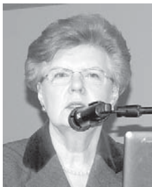
Bijusī Valsts prezidente Vaira Viķe-Freiberga:

„Pirmo reizi esam aicinājuši kopā visus novada skolotājus, un pirmo reizi esam kopā tik lielā pulkā. Šodien vēlos jūs lūgt domāt ne tikai par materiālajām vērtībām. Mums ir jāatgriežas pie garīguma. Ne man jums teikt, ka visu nevar nopirkt par naudu. Rudens lapu smarža, mīlestība, saullēkts, labs vārds un smaids ir pieejams un dodams ikvienam no mums. Skolotāja darbs, lai arī paņem daudz, bet nes arī daudz gandarījuma un prieka. Esmu arī pati to sajūtusi un bieži domāju, kas ir galvenais skolotāja darbā. Manuprāt, tā ir atbildība. Atbildība savu skolēnu priekšā, savas skolas, novada un savas valsts priekšā. Katrs no jums un jūs visi kopā atverat durvis uz pasauli mūsu bērniem. Skolotāja loma ir nenovērtējama. Mīlētā un cienīta skolotāja dzīvības vārds, kas aiziet līdz skolēnu sirdīm, spēj ietekmēt visu tā turpmāko dzīvi. Tas nav viegli, un ne katrs spēj atbildību apzināties, izturēt un nest. Bet tie, kas to spēj, ir skolotāji ar lielo burtu. Esmu pārliecināta – jūs vidū tādu ir daudz.”