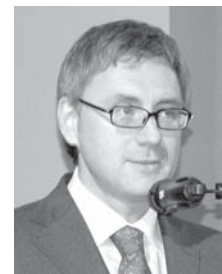
Reģionālās attīstības un pašvaldību lietu ministrs Edgars Zalāns:

gandarīta un pateicīga, ka uz šo konferenci aicinājāt arī izglītības ministru, lai runātu gan par mūsu ikdienu, gan arī par mūsu perspektīvām un nākotni. Tas ir pirmais gads, kad ir pabeigta administratīvi teritoriālā reforma, un pirmais gads pēc skolu tīklu pārveides. Es šajā laikā biju ārkārtīgi ciešā sasaistē ar pašvaldību vadītājiem, skolu direktoriem un skolotājiem, lai labāk izprastu situāciju. Darbs rit, veicamie uzdevumi nemazinās un uz tādas sadarbības nots mums ir arī jāturpina tas, ko veicam jau gadu gadiem. Cienījamie skolotāji, palīdziet mums par darbu. Es ar lielu atbildību visu laiku strādāju pie jūsu prestiža celšanas, pie tā, lai pret skolu un skolotājiem izturētos ar cieņu. Tā ir mūsu kopīga rūpe. Par savu prestižu rūpēsimies visi kopā!”