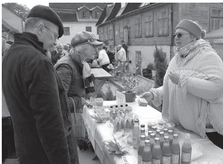
Tirdziņa apmeklētājus ar dabiskajiem vitamīniem – smiltsērķšķu produkciju apgādāja laipna un zinoša pārdevēja.