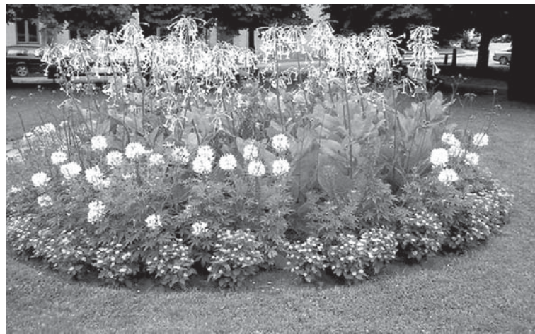
Eksperti uzteic apaļo puķu dobi pie Kuldīgas kultūras centra.

Pilsētas sešu parku, skvēru un zaļo zonu apstādījumu uzturēšanu nodrošina septiņi labiekārtošanas