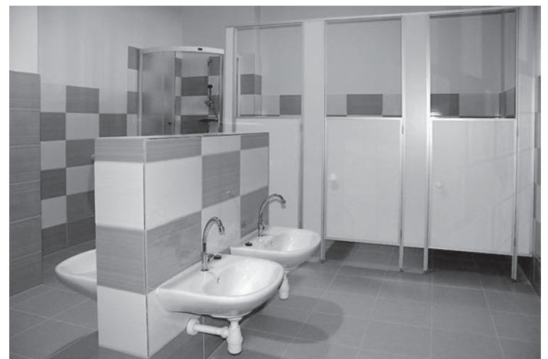
2. kārtā uzcelta vēl viena piebūve, kurā iekārtotas grupiņas un atbilstoši sanitārie mezgli divus gadus veciem bērniem.