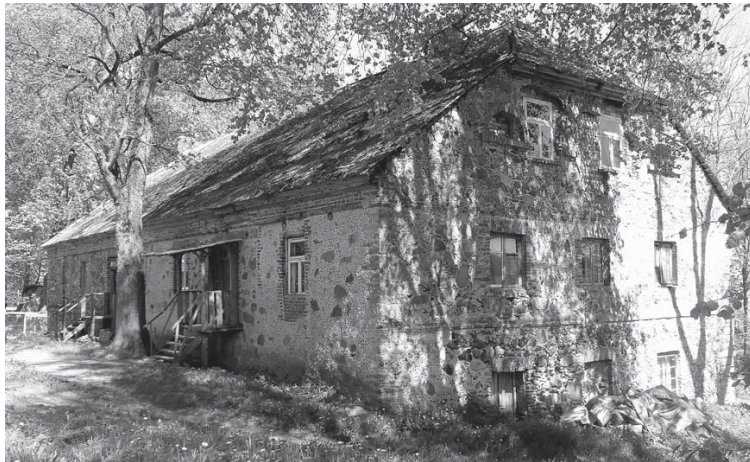
Snēpeles pagasta „Arkādijas” pirms remonta.

Kuldīgas novada pašvaldība, ņemot vērā to, ka nākamgad plānots rekonstruēt Snēpeles ciema ūdensapgādes un kanalizācijas sistēmas, un izmantojot situāciju, ka ēkā notiek remontdarbi, objektā papildus ieguldīja savus līdzekļus, lai nākotnē ēku varētu pieslēgt kopējai ciema ūdens un santehnikas