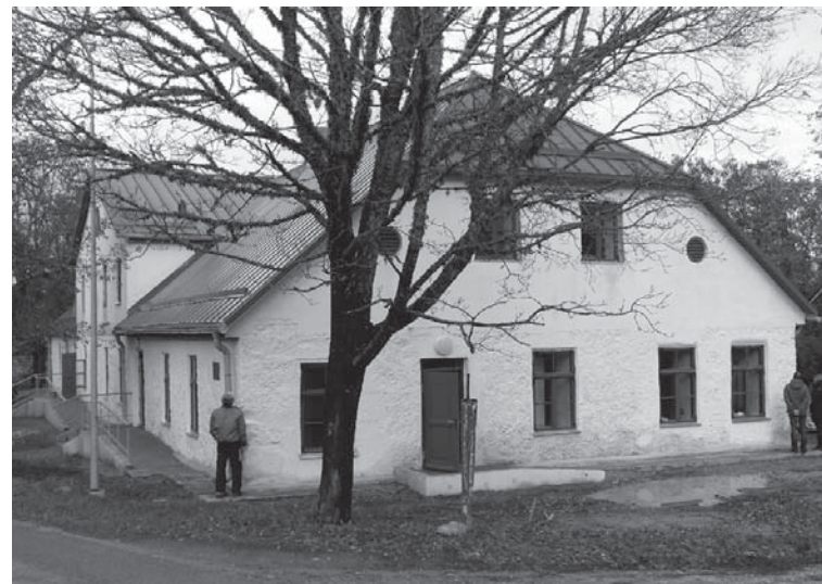
Baltā ēka ceļa malā tagad lieliski iederas Ēdoles pils aizsardzības zonā.

Atgādinām, ka šī gada pavasarī Kuldīgas novada pašvaldība, lai turpinātu un sekmīgi pabeigtu