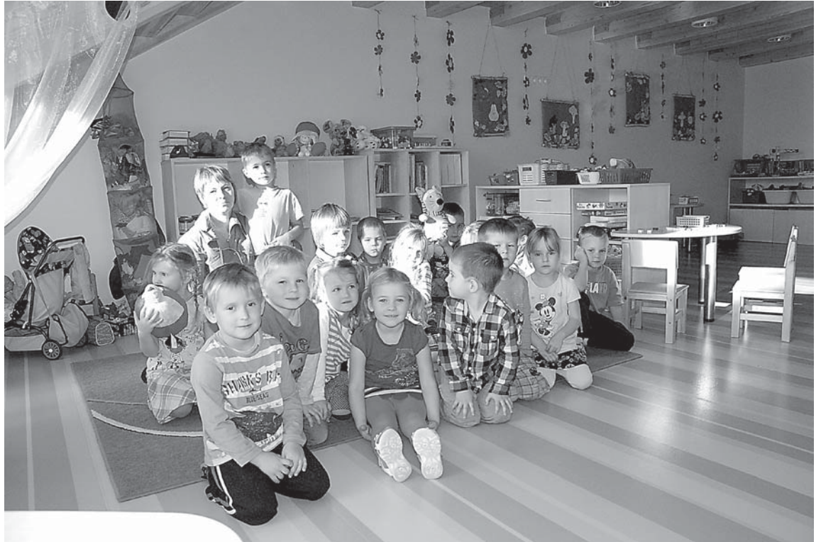
Vidējās grupiņas „Sienāzītis” bērni jaunajās telpās un gādīgo audzinātāju uzraudzībā jūtas ļoti labi.

Bērnodārza ēkas Ziedu ielas malā atjaunošanu uzsāka 2010. gada sākumā. Rekonstrukcijas laikā tika veikta piebūves celtniecība un jau esošās bērnodārza ēkas jumta no-