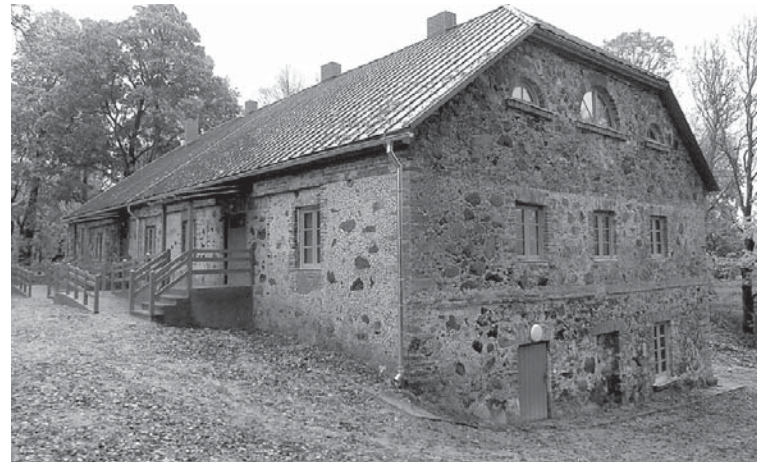
„Arkādijas” pēc renovācijas ar jaunajiem logiem, durvīm, jumtu un glīto fasādi.

nas gaitu, atgādinām, ka pēc atkārtoti izsludinātās iepirkumu procedūras pabeigšanas šī gada 2. maijā starp Kuldīgas novada pašvaldību un SIA „BūvLat grupa” tika parakstīts līgums par būvdarbu veikšanu „Arkādijās”, lai realizētu Eiropas