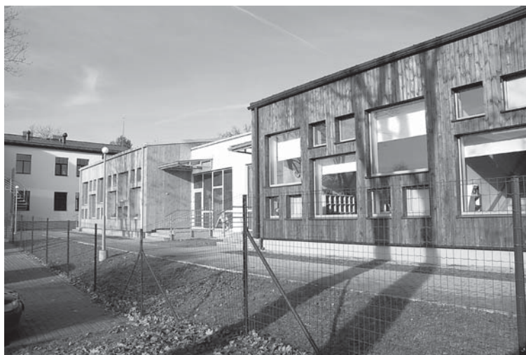
1. kārtas ietvaros tapusi bērnodārza piebūve Ziedu ielas malā.

Kuldīgas novada pašvaldība atkārtoti izsludina pieteikšanos uz vietām PII „Ābelīte” Pelču filiālē. Pieteikties līdz 5. novembrim Izglītības un sporta pārvaldē, Baznīcas ielā 9, vai pa tālruni 63322238, 27842333.