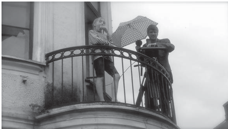
Kadrs no Kuldīgas tēla īsfilmas „Cukurvate”.