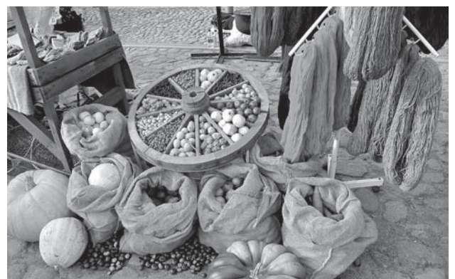
Vārmenieku produkcija un stenda noformējums uzrunāja un priedēja teju katru pircēju.