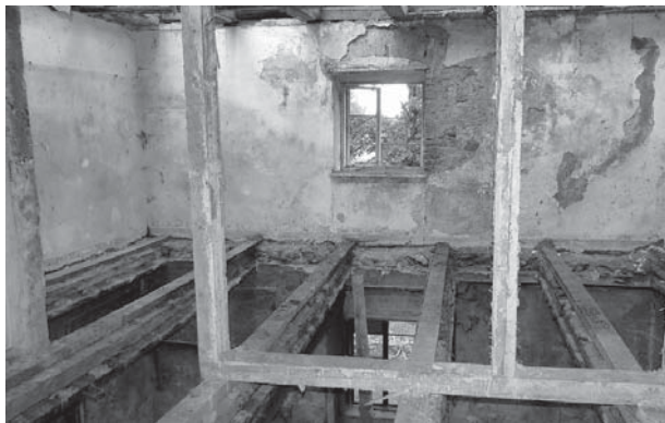
„Arkādijas” būvniecības laikā.

sistēmai. Pašvaldība papildus ir finansējusi arī tādus ar elektrības sistēmas nomaiņu saistītus darbus, ko neatbalsta programmas nosacījumi, kā arī uzlabots iekštelpu vizuālais izskats.