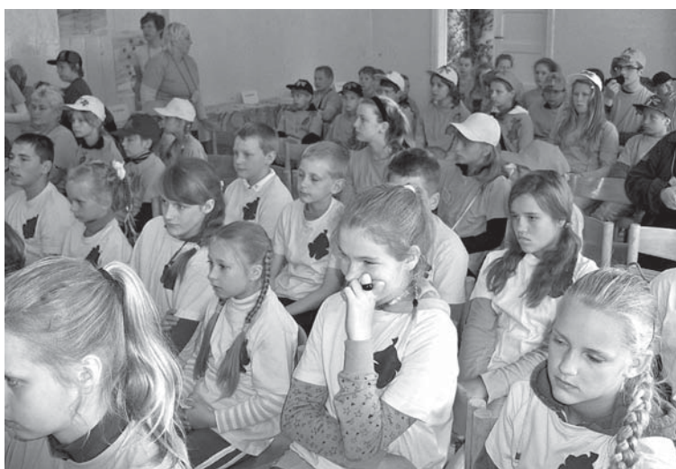
Starptautiskajā projektā „Visu daru es ar prieku” iesaistījās arī Kuldīgas novada Padures un Snēpeles mazpulcēni.

Mazpulku nodarbības nav mācību stundas, tajās mazpulcēni iemācās paveikt kādu darbu. Bērni