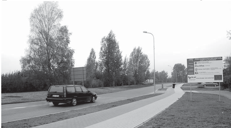
Ievedceļš Kuldīgā – 1,2 km rekonstruētā Ventspils iela – ir laba vizītkarte pilsētai un tās saimniekiem.

Ventspils ielas posmā seguma rekonstrukcija nebija veikta kopš