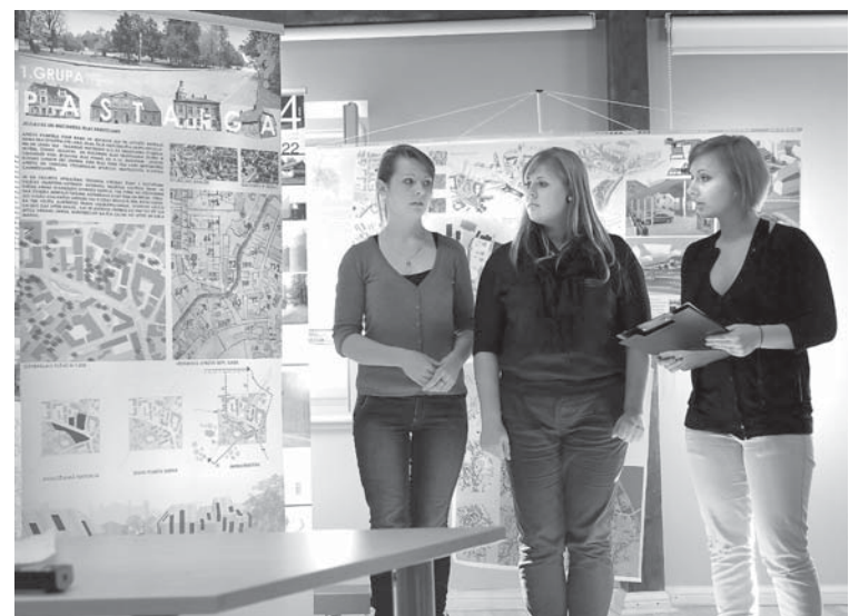
Rīgas Tehniskās universitātes studentes prezentē savu piedāvāto risinājumu apbūvei pie Kuldīgas kultūras centra.

Konferenci noslēdza diskusija par tendencēm Kuldīgas vecpilsētā „Pilsētas vēsturiskās struktūras