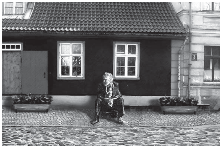
Vizualizācijā – izcilā novadnieka, aktiera Ēvalda Valtera skulptūra, kuru Alekšupītes projekta ietvaros plānots novietot pie vecā Rātsnama.

Šī projekta mērķis ir rekonstruēt Kuldīgas vecpilsētas ielas, laukumu un skvēru, kuri piekļaujas Alekšupītei un atrodas tās ciešā tuvumā.