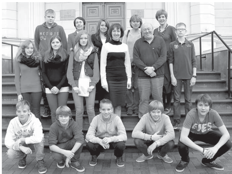
Gēsthahtes reālskolas audzēkņi un pedagogi, kā arī Kuldīgas Centra vidusskolas skolotāji, skolēni un draugi, viesojoties Domē.

Kuldīgu un Gēsthahti Vācijā šķir vairāk nekā 1600 kilometru, taču tas nav šķērslis, lai vairāk nekā divdesmit gadu laikā šo attālumu mērotu abu pilsētu visdažādāko vecumu un profesiju ļaudis, gūstot jaunus iespaidus un ierosmes, kā arī jaunus draugus.