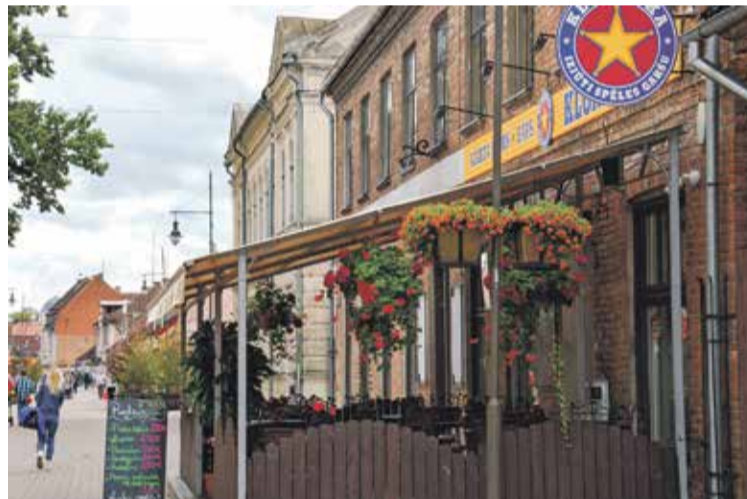
Arī spēļu zāles – bāra "Klondaika" saimnieki parūpējušies, lai uzņēmuma teritoriju rotātu skaisti gaisa dārzi.