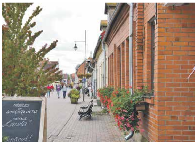
Krāšņas pelargoniju kupenas priecē garāmgājējus pie mēbeļu un interjera lietu veikala "Laura" Liepājas ielā.