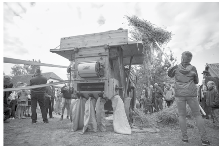
Jau otro gadu Padures pagastā notiks Ražas svētki, kuru laikā tiks kulta labība ar īstu kuļmašīnu "Imanta".

10. septembrī Padurē pie klēts svinēs Ražas svētkus – no plkst. 13.00 vietējie iedzīvotāji un viesi no malu malām aicināti uz jautro mašīntalku.