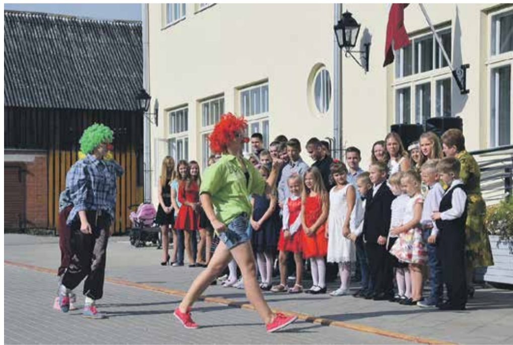
Kuldīgas pamatskolas skolēnus Zinību dienā sveica klauni, 1. klašu audzēkņiem dāvinot dienasgrāmatu un saldu našķi.