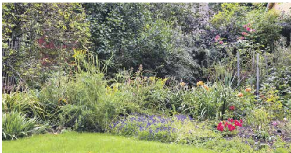
Biedrības "Savējie savējiem" iekārtotajā teritorijā aiz Ventspils ielas 12. nama dobēs un apstādījumos aug ne tikai puķes, bet arī augi, kurus pēcāk izmantos, piemēram, pirtsslotās.