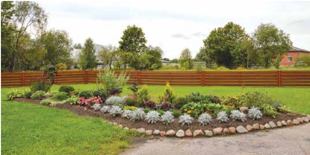
Viens no šī gada lielākajiem pārsteigumiem bija uzņēmuma "Atis Auto" teritorija Tehnikas ielā. Uzņēmuma apkārtnē iekārtoti gaumīgi apstādījumi, kuru tapšanā saimnieku konsultē kāda dārzkopības studente.

Īpašumus konkursiem pārsvarā bija pieteikuši citi cilvēki – radi, draugi, kaimiņi vai pat garāmgājēji, kuri novērtējuši dārza skaistumu un teritorijas sakoptību, saimnieka ieguldīto darbu un pūles. Īpašumus Kuldīgas pilsētā žūrija vērtēja četrās kategorijās – skaistākais Kuldīgas dārzs, sakoptākais daudzdzīvokļu māju pagalms, sakoptākais uzņēmums Kuldīgas pilsētā un skaistākais gaisa dārzs. Vērtējamo objektu vidū bija gan tādi, kuri konkursam pieteikti arī iepriekšējos gados, gan tādi, kuru skaistums un sakoptība pamanīta vien šogad. Konkursa rezultātus paziņos un uzvarētājus sveiks 1. oktobrī Hercoga Jēkaba gadatirgus laikā.