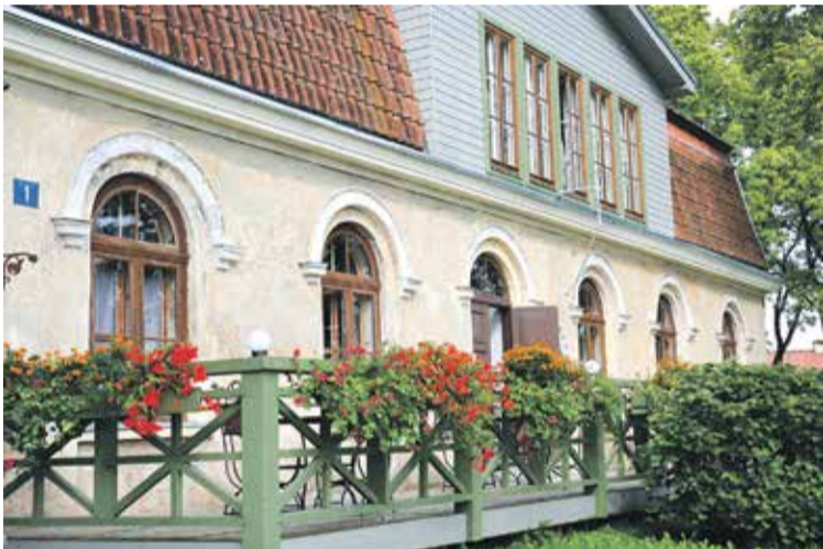
Restorāns "Bangert's" Pils ielā izceļas ne tikai ar krāšņiem puķu stādījumiem, bet arī ar īpašo garšaugu stendu, ko ievērojis ne viens vien garāmgājējs.