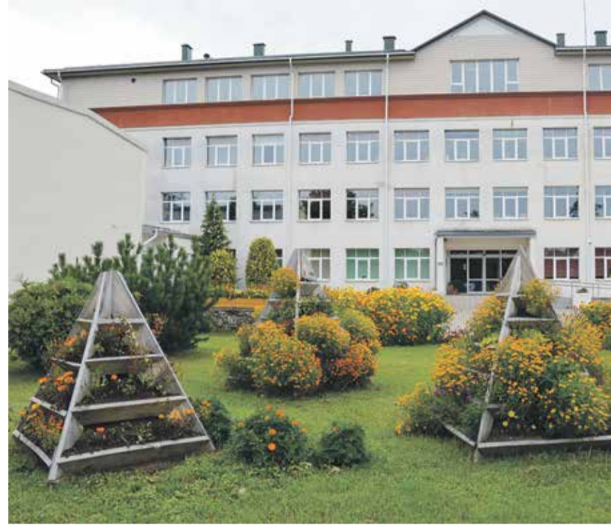
Krāšņas ziedu kupenas grezno Viļa Plūdoņa Kuldīgas ģimnāzijas teritoriju. Ziedi sastādīti gan no veidotās puķu kastēs, podos un pat ratos, gan dobēs. Viena dobe atgādina Latvijas kontūru un baltiem ziediem, bet cita veidota kā kompass. Daudzi no skolas teritorijā iestādītajiem augiem ir