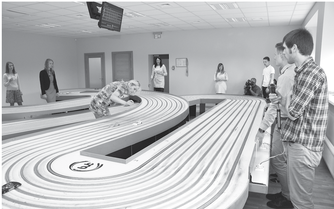
Tehniskās jaunrades centra telpās izveidota starptautiskiem standartiem atbilstoša automodelisma trase.

KRISTĪNE DUĻBINSKA, Mārketinga un sabiedrisko attiecību nodaļas vadītāja