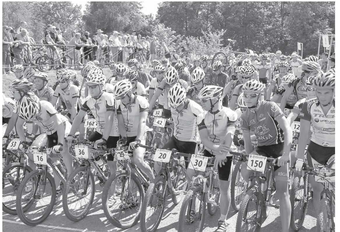
Gandrīz divi tūkstoši sportistu 10. jūlijā stājās uz starta Kuldīgas pilsētas estrādē, lai piedalītos SEB kalnu divriteņu maratonā, kas šogad svin 10. jubilejas sezonu.