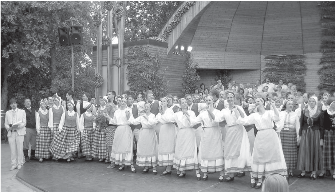
Dziedātāji un dancotāji no Skrundas un Kuldīgas novada atklāja Dižkoncertu Rendas estrādē.

Pēc vairāku gadu pārtraukuma sestdien, 2. jūlijā, Kuldīgas novada dejotājus, dziedātājus un lietišķās mākslas kolektīvus atkal kopā pulcēja Tautas mākslas svētki, šoreiz – Rendā.