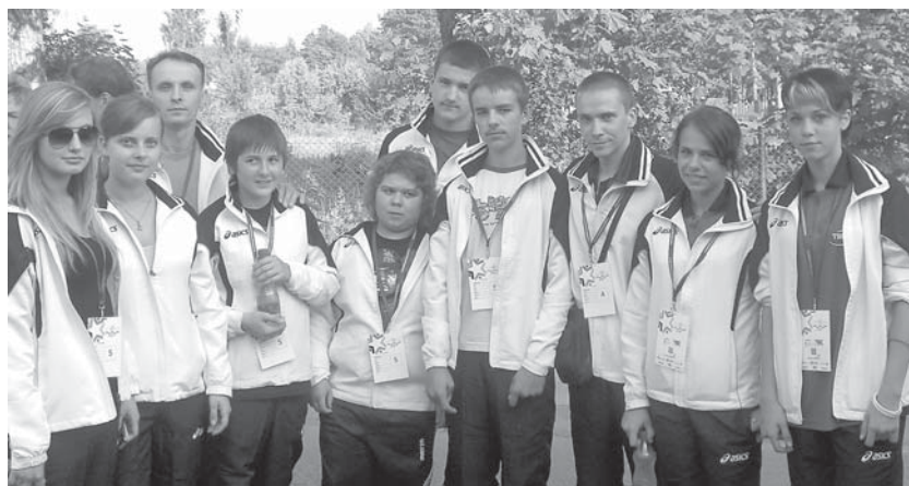
Mūsu tenisisti olimpiādē izcīnīja piecas medaļas.