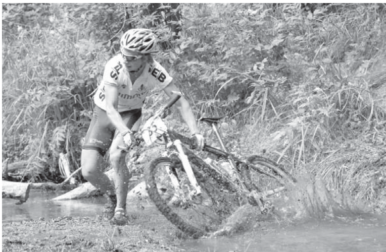
Sacensību dalībniekiem trase vijās pa grants un meža ceļiem, bija dažādi nobraucieni un nācās šķērsot arī upīti.