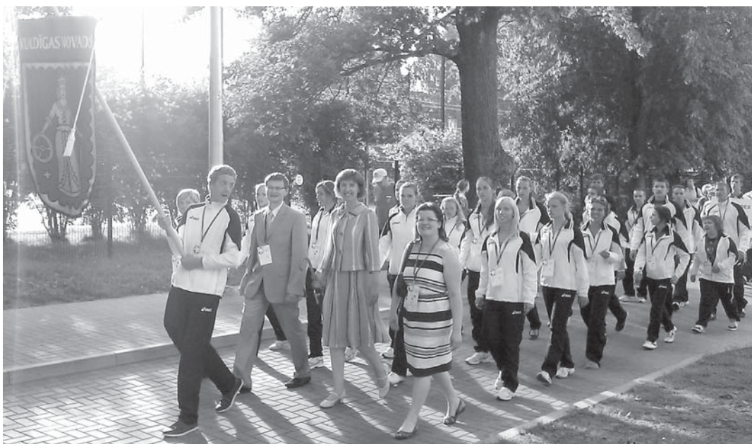
Pirms sacensībām visi olimpiādes dalībnieki devās gājienā.

Latvijas Jaunatnes olimpiādē, kas no 1. līdz 3. jūlijam norisinājās Jūrmalā, Kuldīgas novada sportisti izcīnīja 12 medaļas.