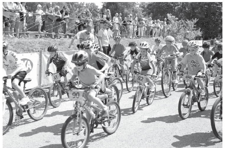
Jaunie riteņbraucēji izmēģināja spēkus „Lāsēna” distancē bērnu sacensībās.