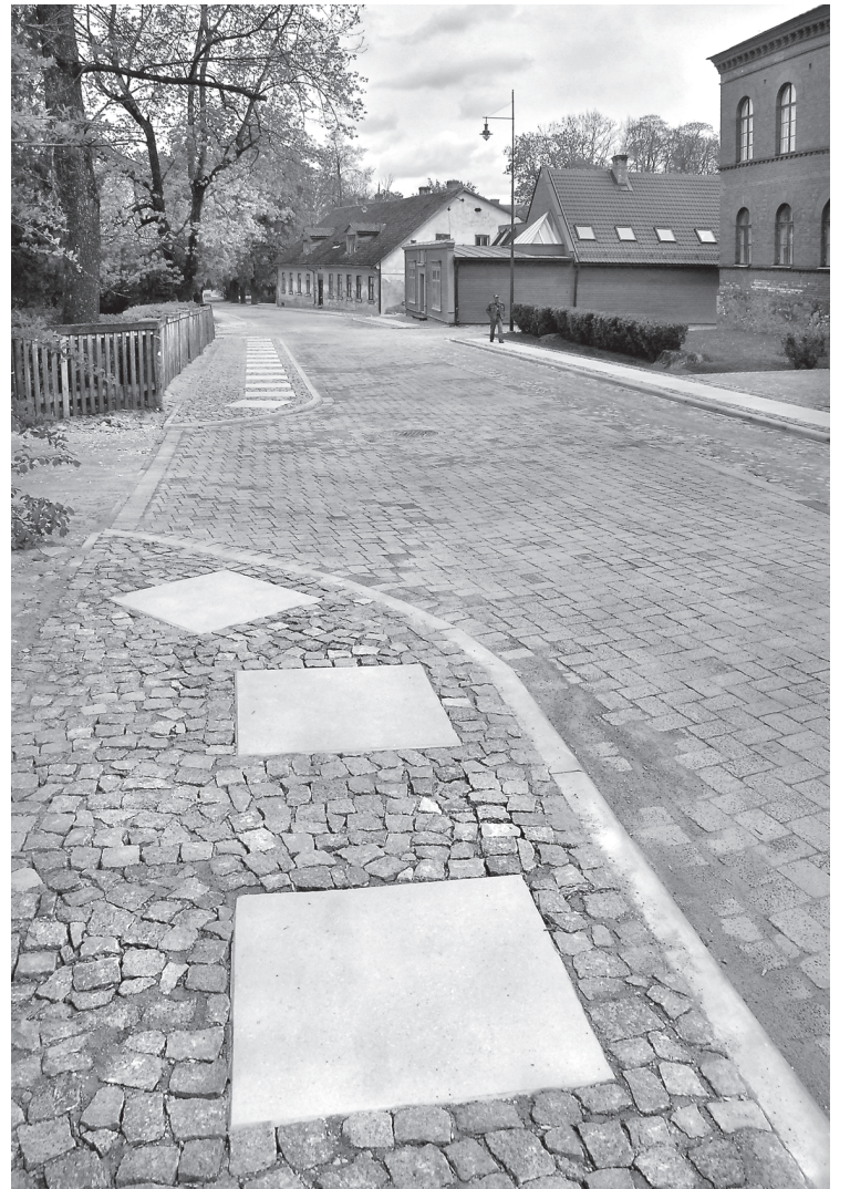
Skaistā un sakārtotā Kalna iela kļuvusi par vienu no košākajām rotām Kuldīgas vecpilsētā.

„Esmu gandarīta par mūsu politisko drosmi un izšķiršanos pagājušajā rudenī ņemt kredītu un būvēt Kalna ielu. Būvēt tajā ūdensvada un kanalizācijas tīklus, pirms visā Latvijā šis projekts nebija sācies, un plānot finansējumu visas ielas atjaunošanai. Mūsu lēmums bija ļoti izsvērts un tālredzīgs, ja nebūtu to izdarījuši, Kalna iela šodien nebūtu rekonstruēta,” informē domes priekšsē-