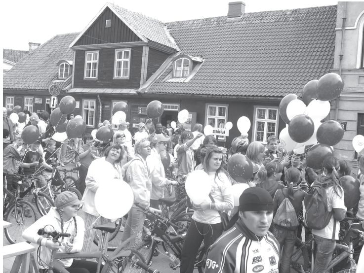
21. maijā Kuldīgā jau otro reizi notiks velodiena „Eiropa. Holande. Kuldīga. Domā zaļi!”. Pasākuma rīkotāji aicina velobrauciena dalībniekus reģistrēties jau šodien www.visit.kuldiga.lv

tās. Trase vedīs cauri Kuldīgas vecpilsētai, garām Sv. Katrīnas baznīcai, pāri vecajam Ventas tiltam, no kura paveras burvīgs skats uz Eiropas platāko ūdenskritumu – Ventas rumbu. Pēc tam ceļš vedīs pa Riežupes dabas parku, kur brauciena dalībniekiem būs iespējams apmeklēt smilšalas. Pēc nelielas atpūtas riteņbraucēji dosies tālāk pa maršrutu, piestājot kontrolpunktus, lai veiktu dažā-dus uzdevumus.