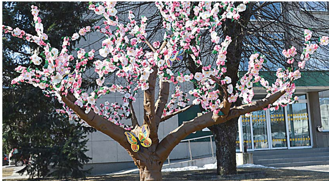
Gaidot silto pavasari, Kuldīgā zied ābele no PET pudeļu materiāliem.

Svarīgi atcerēties, ka Lielās talkas atkritumi nav vecās mantas no māju pagrabiem un atkritumu kaudzes privātmāju teritorijās. Lielā talka ir koplietošanas teritoriju sakopšanas pasākums, kurā aicināts