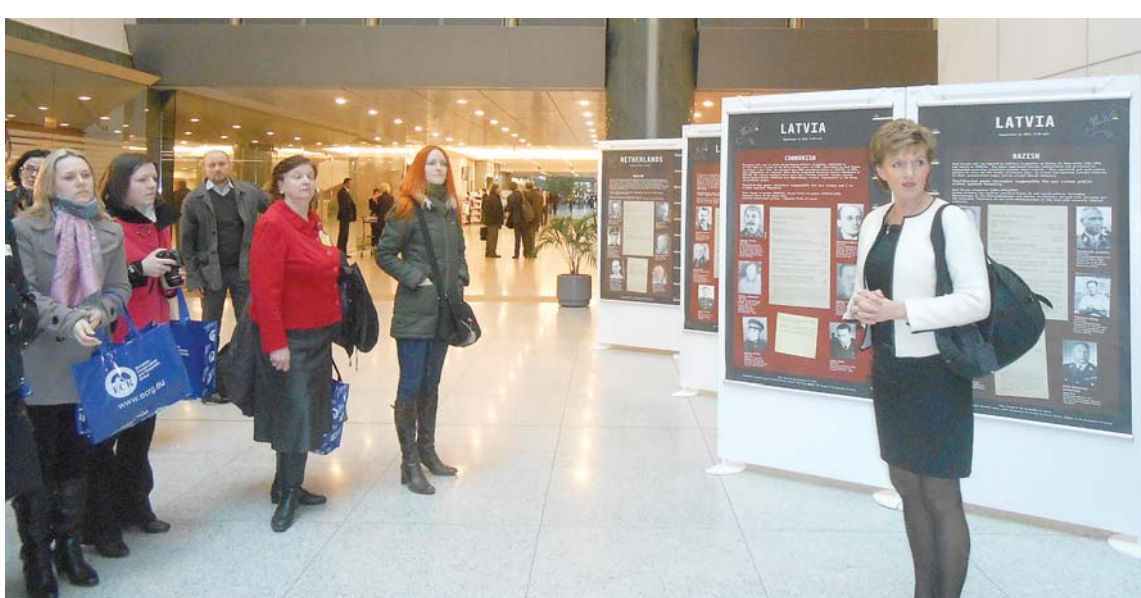
Eiroparlamenta deputāte Inese Vaidere Latvijā pašvaldību sabiedrisko attiecību speciālistus un pārējos interesētus iepazīstina ar izstādi „Totalitārisms Eiropā”.

PSRS okupācija atstāja smagas sekas arī uz Latvijas tautsaimniecību. Ja pirms PSRS okupācijas Latvija bija attīstīta Eiropas valsts, kuras labklājības līmenis tālu pārsniedza kaimiņos esošās PSRS skaudro realitāti un tautas ienākums uz vienu iedzīvotāju Latvijā