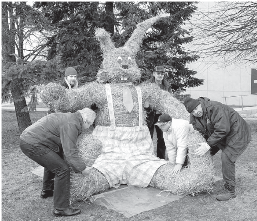
Sēdošais zaķa puika ir 2,60 metrus augsts, tā apkārtmērs – 3 metri. Lielie vides dekori gan bērnos, gan pieaugušajos raisa smaidu un vēlmi pie tiem fotografēties.