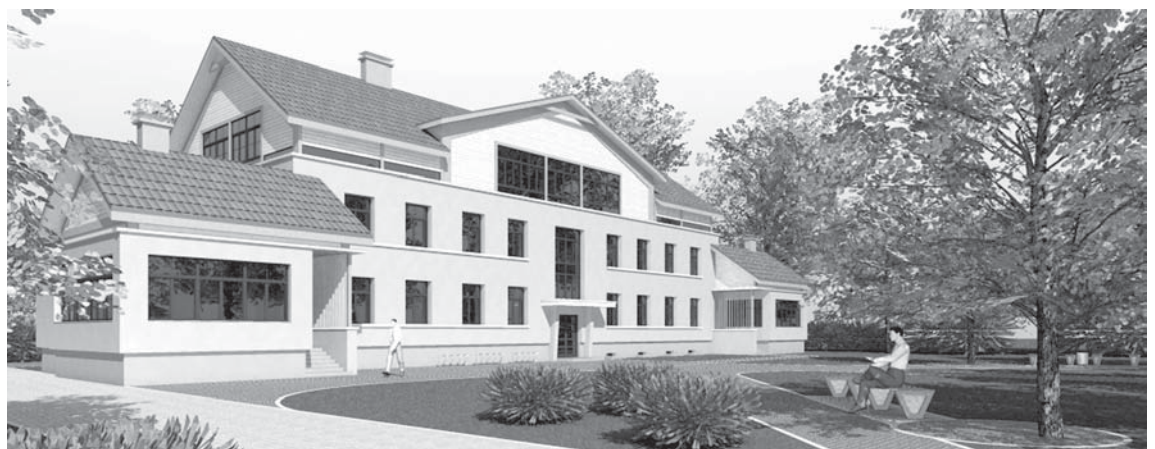
Vizualizācija: skolai piederošajā teritorijā Pētera ielā 10 gājēju celiņi un autotransporta ceļi tiks rekonstruēti. Demontēs nolietoto asfaltbetona segumu, daļēji to nomainot un daļēji tā vietā iesējot zālienu. Projektējamie celiņi paredzēti cietā segumā. Plānoti betona bruģakmeņi kombinācijā ar plēsta granīta bruģakmens joslām.