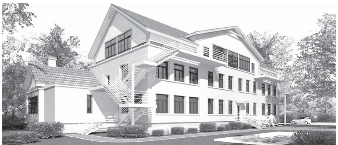
Projekta rezultātā tiks uzlabota Kuldīgas Mākslas un humanitāro zinību vidusskolas infrastruktūra, rekonstruējot skolas telpas Pētera ielā 10, kā arī uzbūvējot 3. stāvu, tādējādi izveidojot piemērotas telpas mākslas nodarbību organizēšanai.