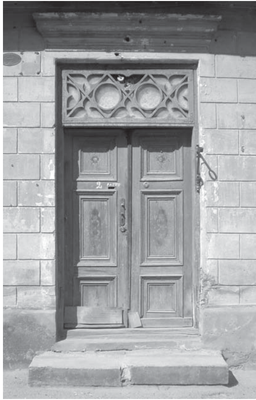
Priedes koka dēļu divvērtņu durvīm pilnībā zuduši seši historisma stila dekoratīvie elementi, vien saglabājušās vāji jaušamas silueta kontūras.