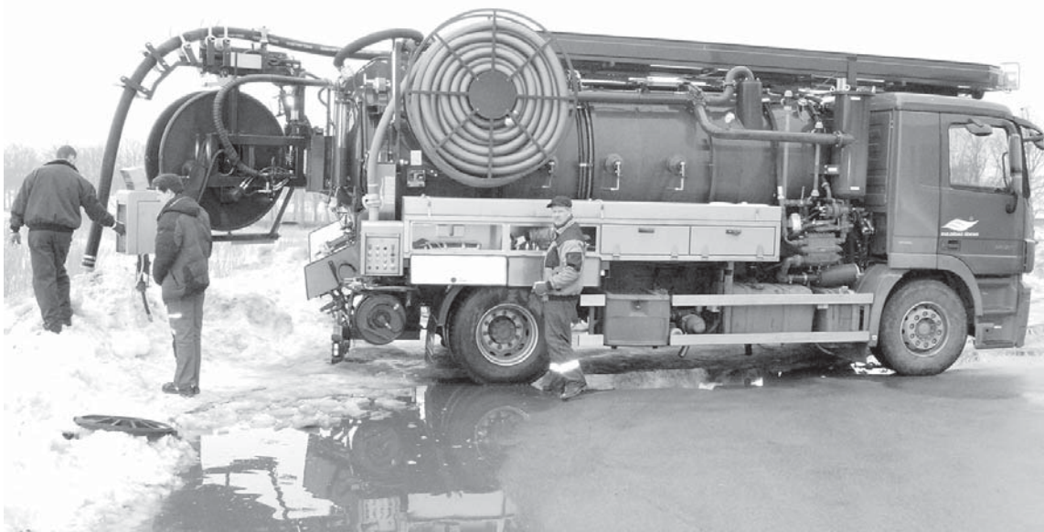
SIA „Kuldīgas ūdens” jauniegādātā mašīna aprīkota ar cirkulācijas sūkni, lai varētu ekspluatēt kanalizācijas tīrīšanas sistēmu arī ziemā līdz –15 grādiem.

Šādas mašīnas vispār neražo sērijveidā, bet komplektē atbilstoši pasūtītāja vajadzībām. Jauniegādātā mašīna nokomplektēta tā, lai maksimāli atbilstu Kuldīgas spe-