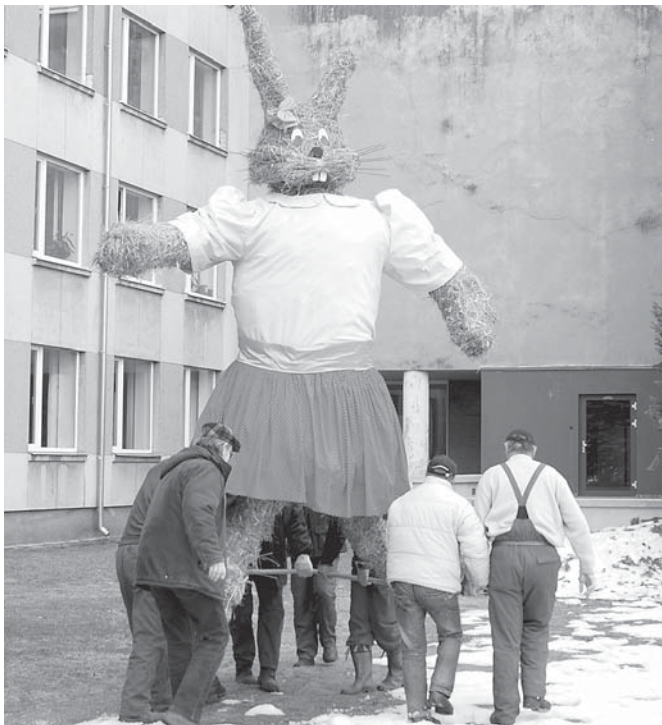
Sagaidot Lieldienas, Kuldīgas Pilsētas laukumu rotā 4 metrus augsta zaķeni, tās apkārtmērs 2,70 metri.

„Milzu figūras ir mūsu roku darbs. Varējām jau kaut ko nopirkt, bet finansējums ir ļoti ierobežots, un, šķiet, pašiem iznāca pat labāk. Katru gadu uztaisām kaut ko jaunu, lai pēc iespējas vairāk izrotātu pilsētu. Man ir prieks, ja spēju dāvēt citiem prieku,” saka māksliniece, kura lieliskus dekorus pilsētā rada jau trešo gadu.