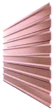
"RUUKKI" kods T 20

Izmēri doti centimetros, augstuma atzīmes - metros.